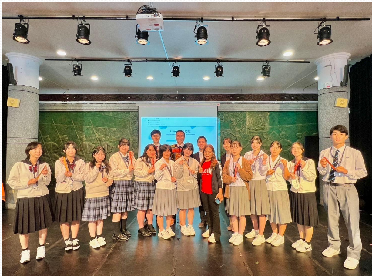
來義高中接待鹿兒島高校