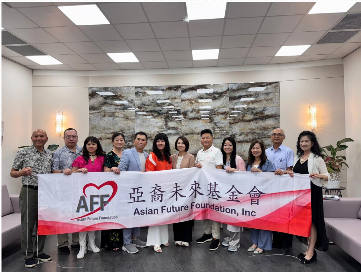
美國亞裔未來基金會