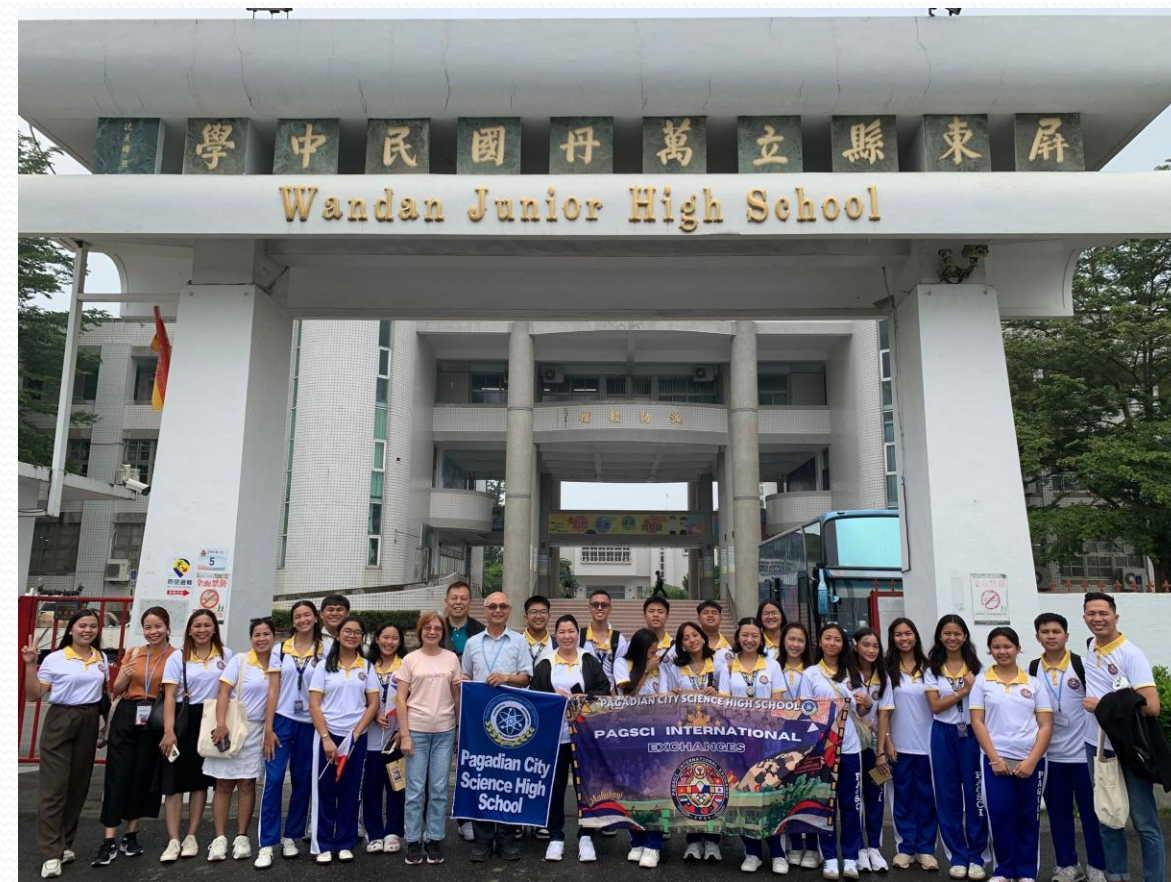
萬丹國中接待菲律賓科學高中