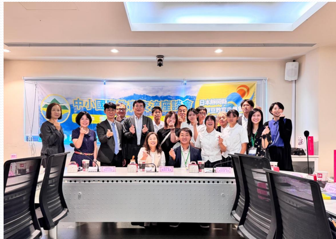
日本靜岡西伊豆教育委員會