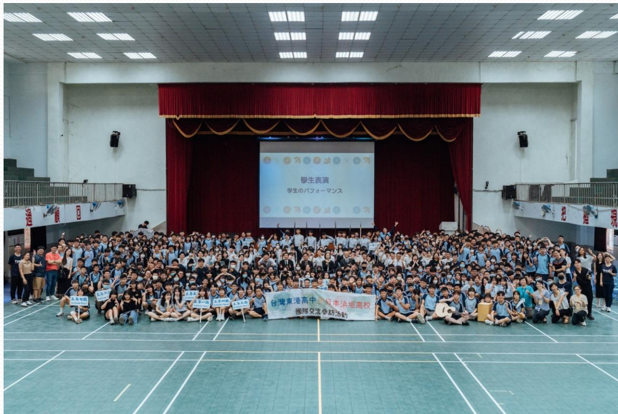
東港高中接待日本兵坂高校