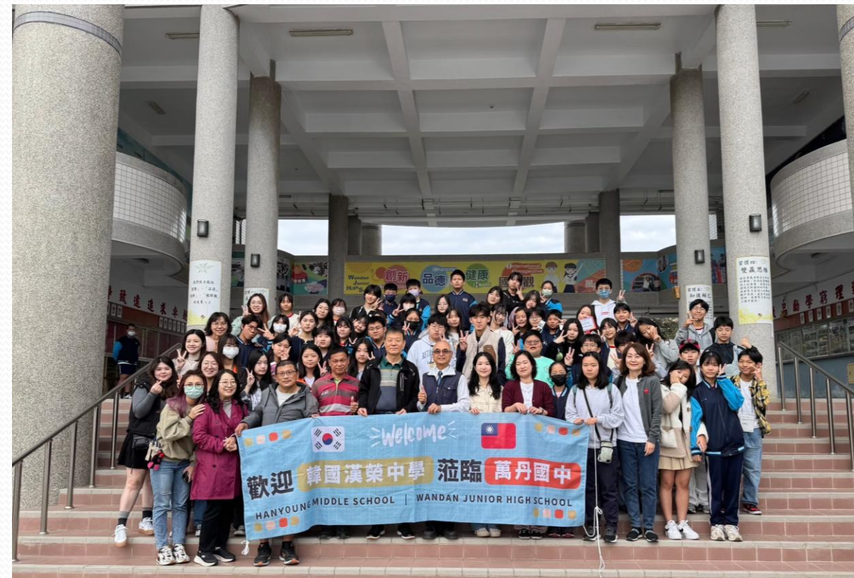
萬丹國中接待韓國漢榮中學